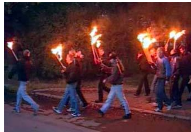
Скинхеды. Факельное шествие в Петербурге.